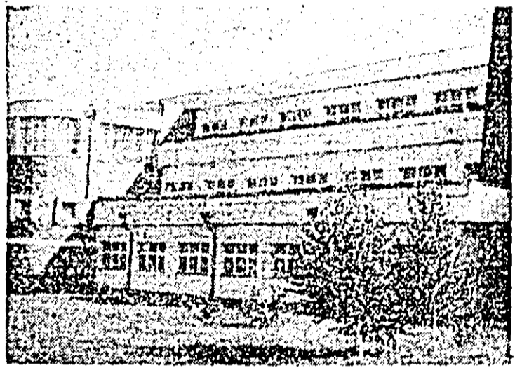
Stațiunea de cercetări viticole Mîntuș. Vedere exteroară.

În încheierea adunării generale a luat cuvîntul tovarășul Trifon Darie, prim-vicepreședinte al Consiliului popular județean care și-a exprimat ferma convingere că lucrătorii asociației, aplicînd în viață măsurile stabilite în spiritul sarcinilor prevăzute de documentele Congresului al XIII-lea al partidului, vor realiza și depăși indicatorii de plan din anul viitor, primul an al noului cincinal.