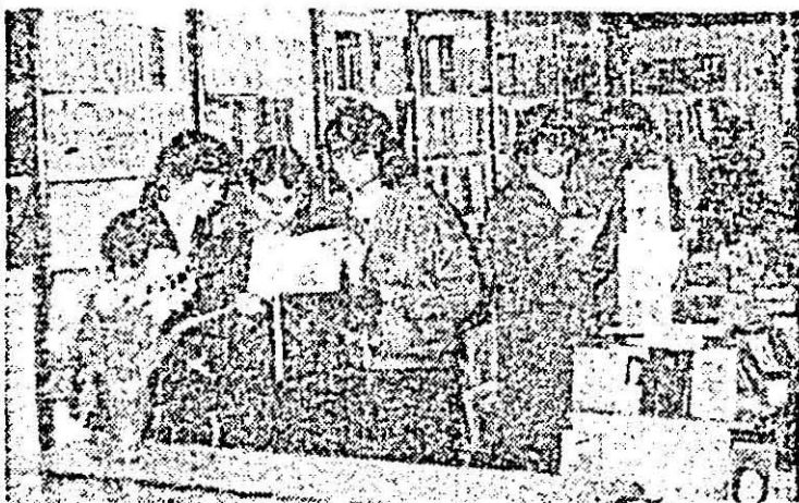
Aspect din librăria din orașul Lipova.