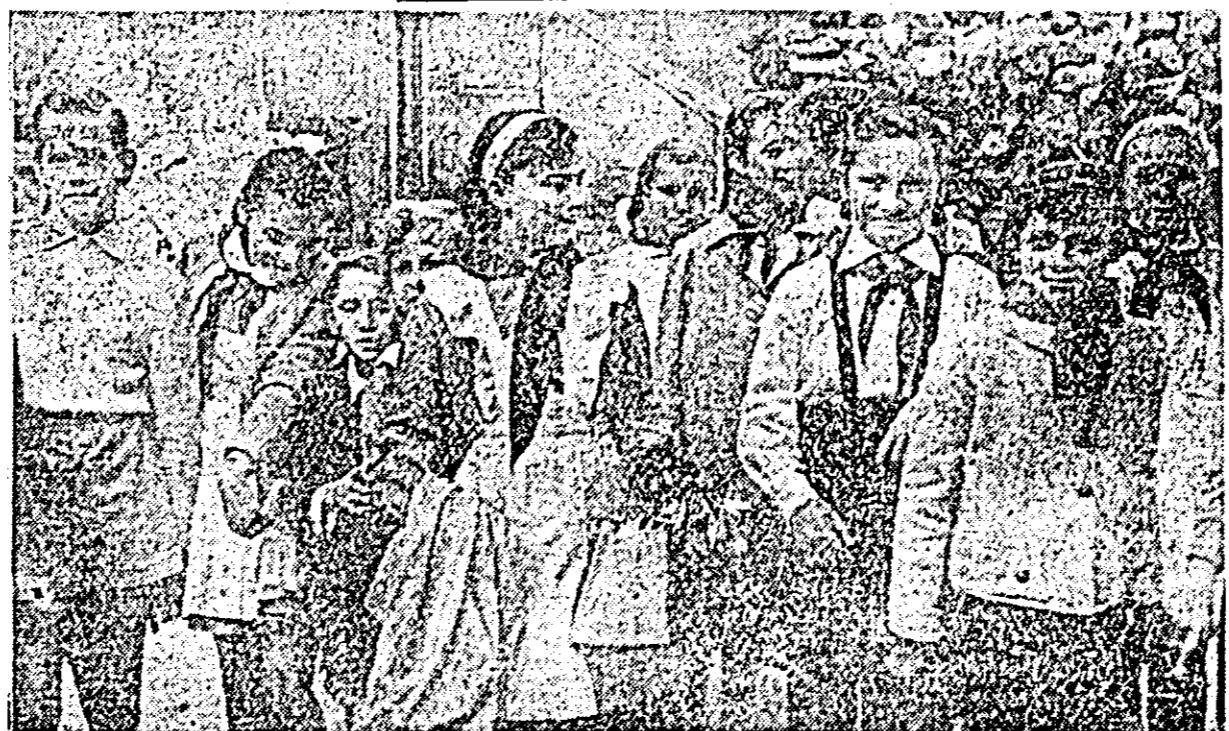
IN CLIȘEU: Aspect de la deschiderea școlilor.