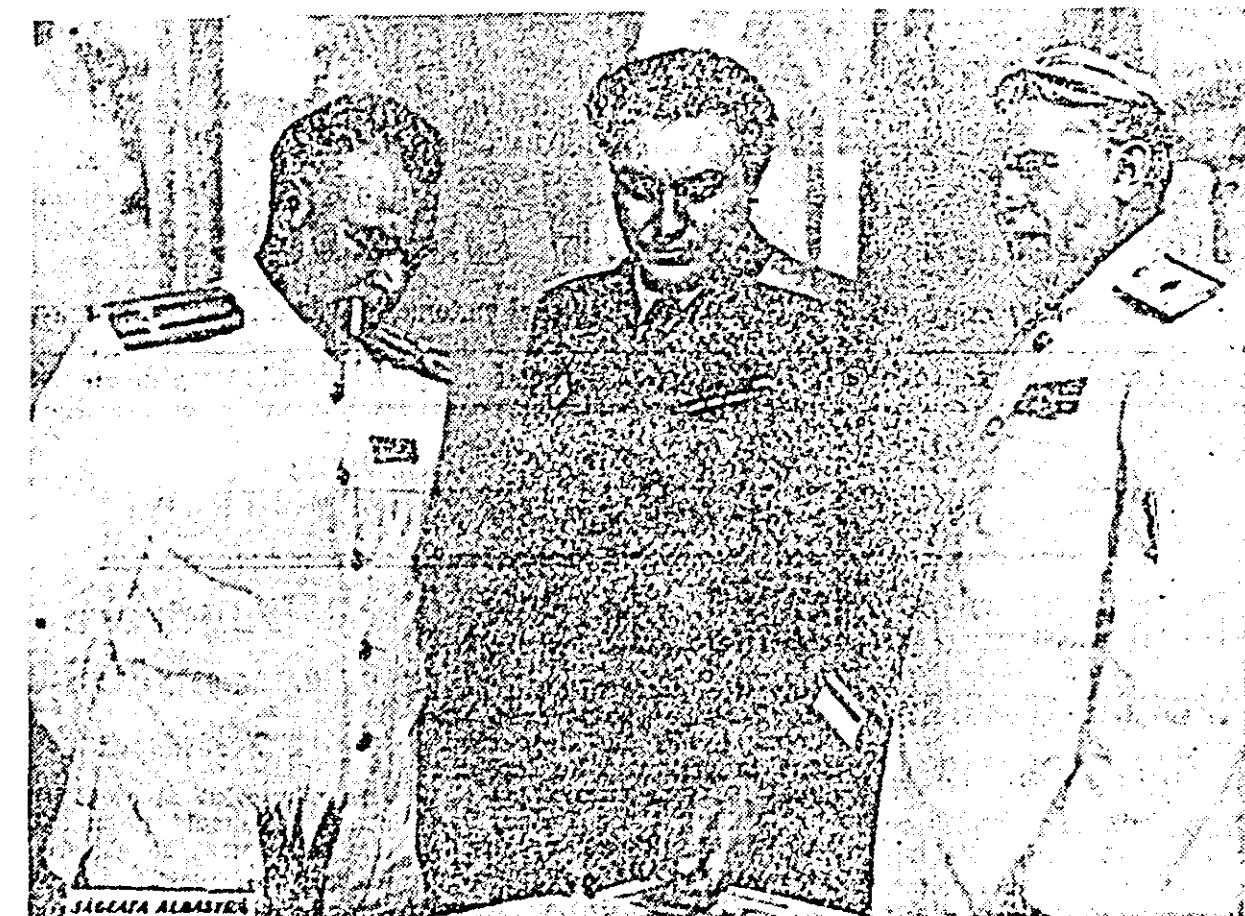
IN OLȘEU: o scenă din film.

CINEMATOGRAFIE „GH. DOJA”: Săgeata albas-tră; „M. BALCESCU”: Taina lui Zerkov; „I. HERBAK”: Prima zi; „L. L. CARAGIALE”: O carieră ratată; „TINERETU-LUI”: Simpaticul nostru doctor; „SOLIDARITATEA” (Gal): Fațoarea lumii; „MAXIM GOR-KI” (Mileșca): La ordinele d-voastră; „PROGRESUL” (A-radul Nou): Patru pași în nori; „LIE PINTILIE”: Dinco-lor de braz.