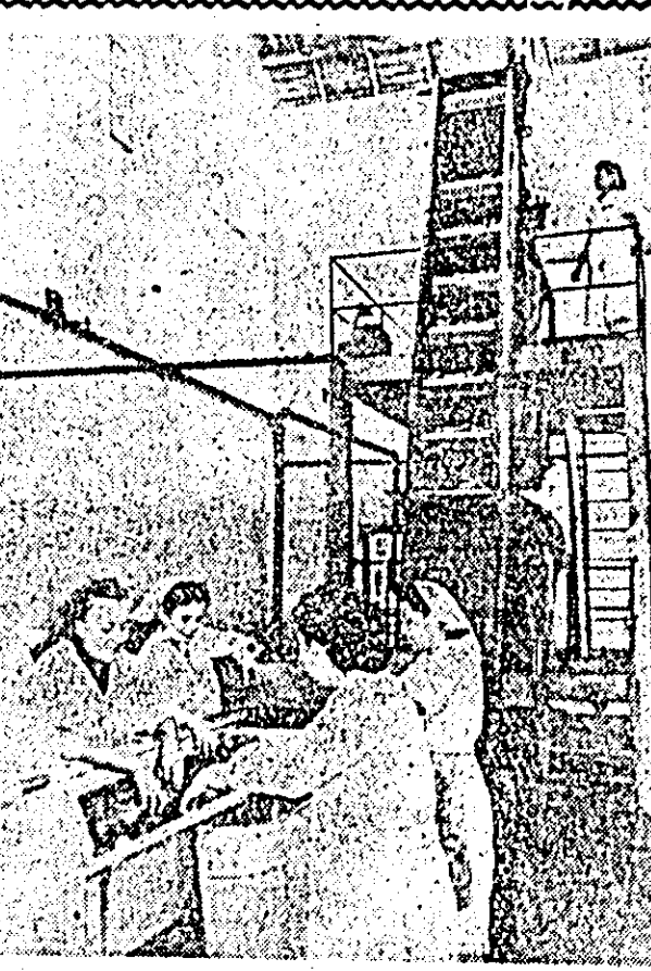
Grupul de spălat roșii în plină activitate.

Lăzile cu roșii, ardei, pere și altele legume și fructe ce sosesc zilnic în fabrică, mîile de cutii și borcane de conserve, ce sînt expediate în fiecare zi, forțata din fabrică, dovedesc că aici campania de fabricație este în toi. În prezent, pe primul plan se găsește prelucrarea roșiilor, cel mai abundent produs de sezon. Pre-