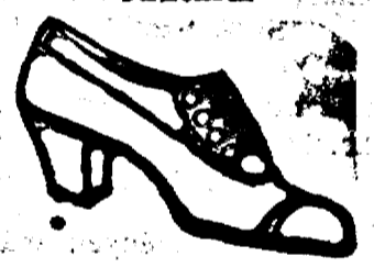
„BALLY”-féle francia fél- és magassáru cipőknek főelárústitója.