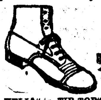
„HELIA” és „TIP-TOP” hígenikus gyermekcipőknek szintén egyedül eladási helye.