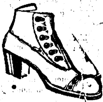
Világbiró „VERA” amerikai férfi és női cipők egyedül eladási helye.

Nagy választék amerikai alakú férfi és női cipőkben 10.-, 12.- és 14.- K-és árakban.