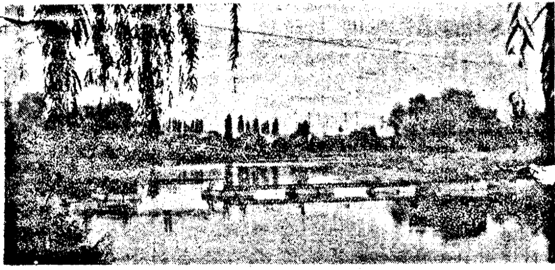
Toamnă pe Mureș.