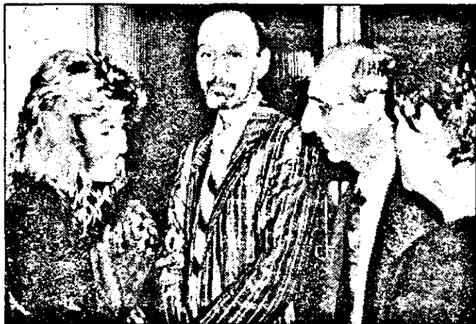
... la înmănarea diplomelor.

să desfășoare activități de perfecționare profesională.