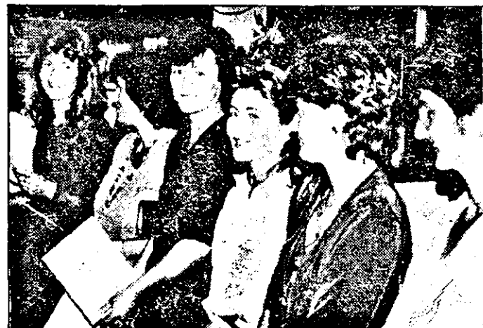
Un grup de tineri absolvenți zămbitori dar cu gândul deja la ziua de mâine.

rămâne totuși viața, în cazul dat felul în care vor reuși să se impună în fața viitorilor patroni, respectiv manageri, dar mai ales