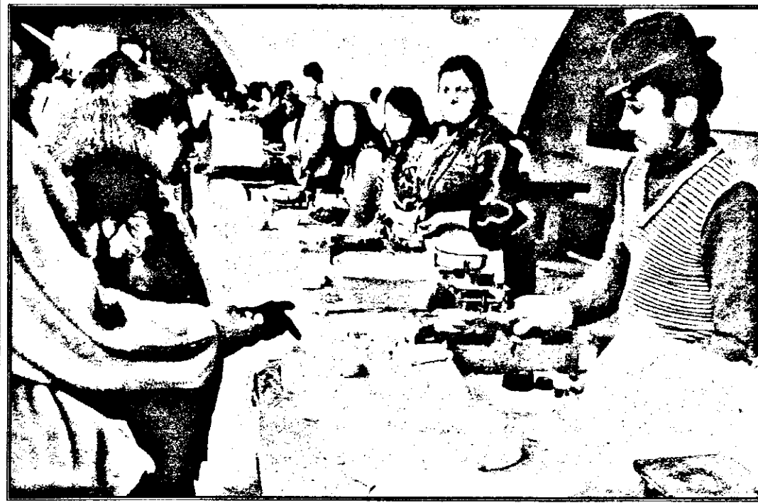
- Pe gustate? - Pe...