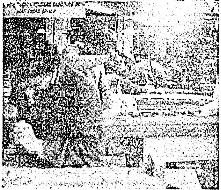
Aspect de muncă în secția sculptură a Combinatului de prelucrare a lemnului Arad.

al Partidului Muncitoresc Unificat Polonez, președintele Consiliului de Stat al Republicii Populare Polone, va efectua o vizită de lucru în Republica Socialistă România în a doua parte a lunii noiembrie a.c.