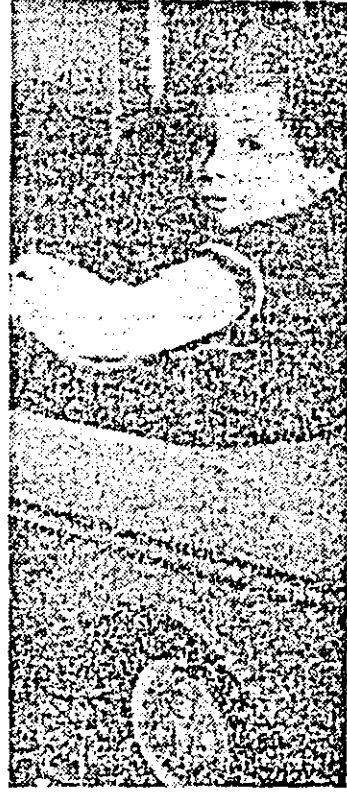
Un viitor „pilot de formula 1...”