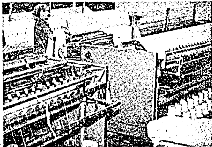
Aspect din atelierul de preparare al Întreprinderii textile.