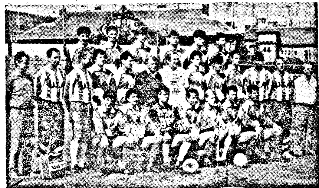
MEMORIA PELICULEI: EI SÎNT CEI CE AU READUS FOTBALUL ARĂDEAN PE PRIMA SCENĂ FOTBALISTICĂ A ȚĂRII

Cumpărînd ziarul „ȘTIREA” participați la sprijinirea mișcării sportive din ARAD.