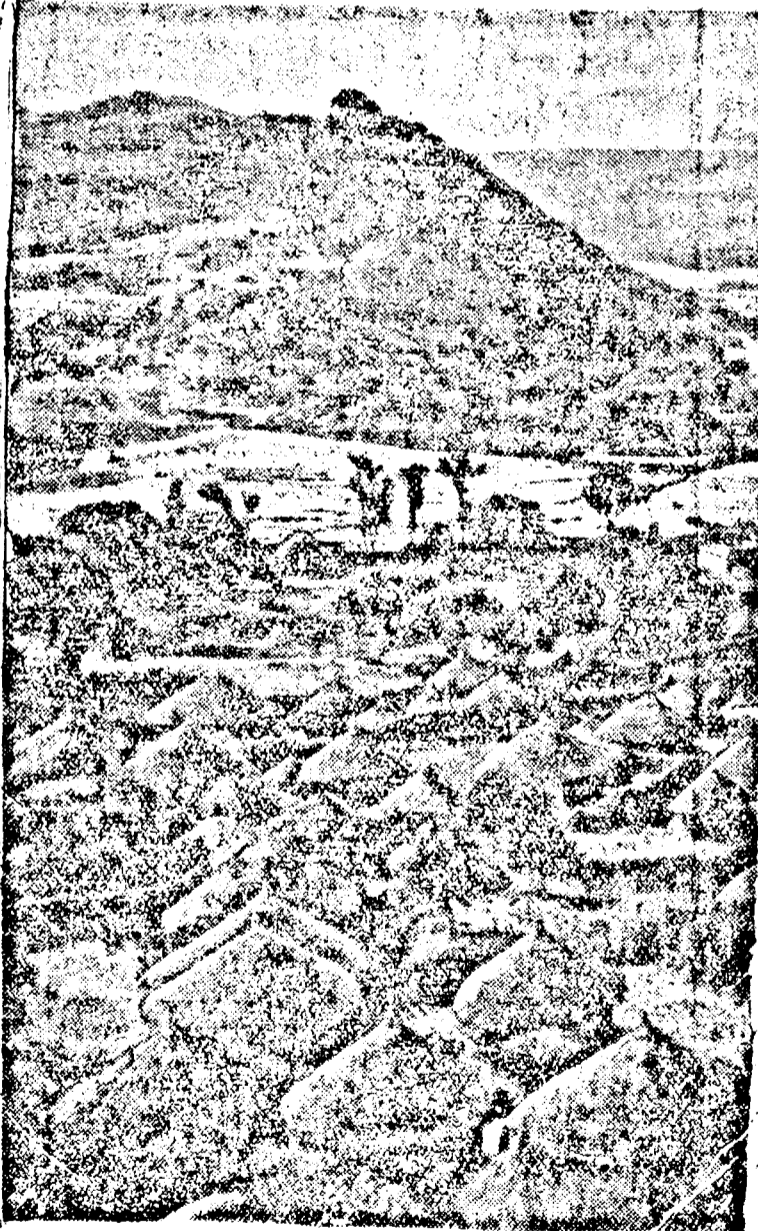
Az abesszin császárok szent temetkezési városának látképe

Ujabb kis fehér felhők, azután az egész ég kihimeződik és mindenütt kis felhőket látunk.