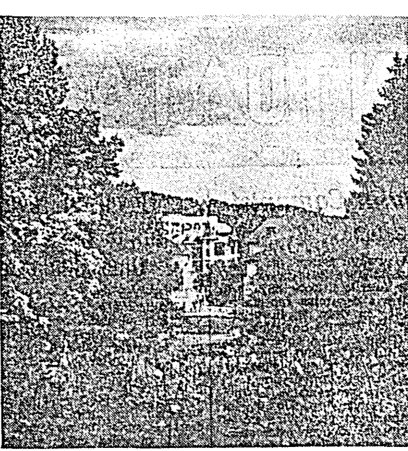
Vedere din Gavra, frumoasa stațiune balneară de pe Valea Olteului care în aceste zile de vară cunoaște animația a mil și mil de oameni ai muncii sosiți la odihnă și tratament.