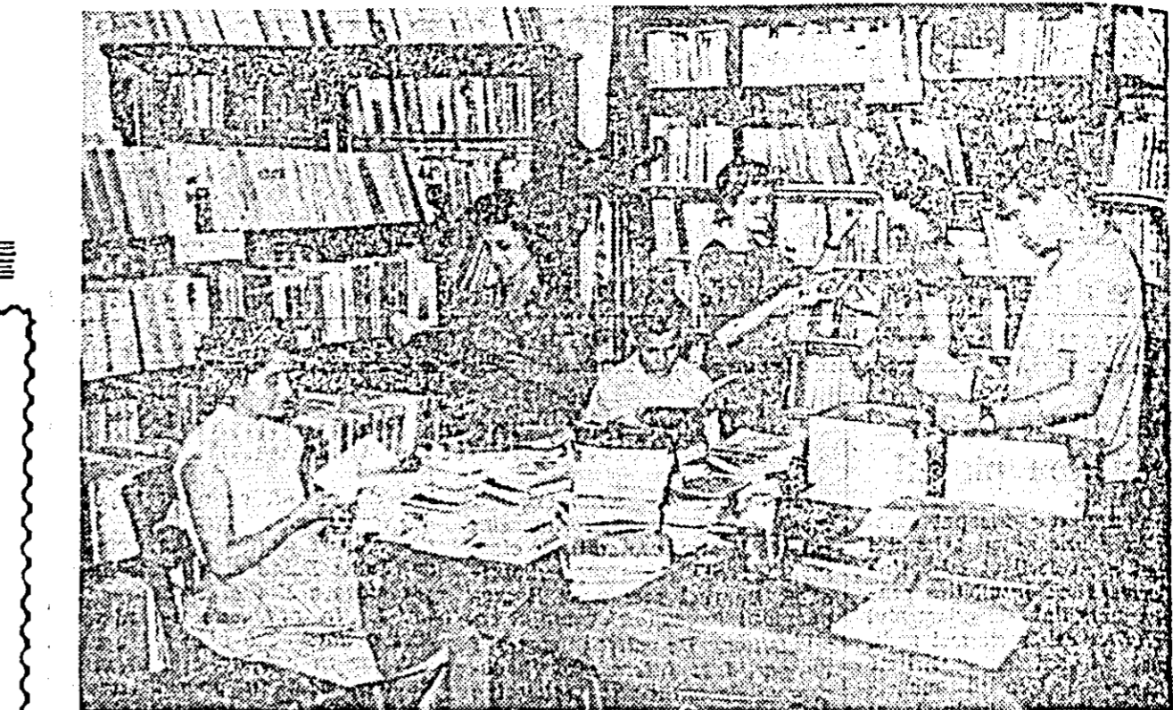
Biblioteca clubului CFR posedă un număr de 18.792 volume care stau în permanență la dispoziția muncitorilor feroviar. ÎN CLIȘEU: Un aspect de la biblioteca clubului CFR.

În ziua de 23 August 1949 ca almanah al Filialei Timișoara a Uniunii Scriitorilor, revistă „Scrisul bănațean” își sărbătorește apariția numărului 100. Acest eveniment reprezintă, în activitatea unei publicații, un potrivit prilej de autoanaliză, un îndemn sigur spre noi realizări.