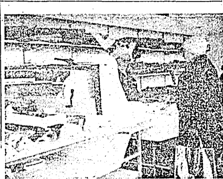
Aspect din magazinul I.C.S.M. textile din Ineu.