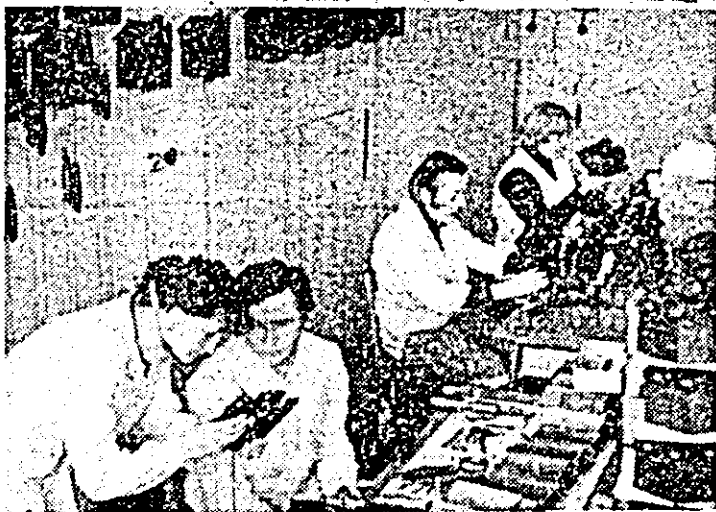
Întreprinderea „Victoria” — atelierul de montaj. Aici se assemblează ceasurile de porele cu cuc (P 17).