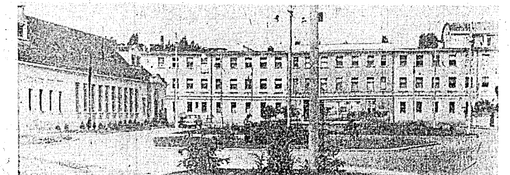
O frumoasă priveliște se dezvoltă în fața intrării fabricii „Teba”.

pericolînd îndeplinirea sarcinilor de plan. În multe locuri studiindu-se posibilitățile de remediere acestea au fost găsite. Astfel, prin modificarea schemei de croire a pieselor din cherestele mai subțiri (adică la dimensiunile minime) a sporit capacitatea uscătoarelor unde erau gîtuiri serioase. Pe de altă parte, aplicînd o inovație la aparatul de lustruit Bössnergasser, acesta poate fi folosit acum la întreaga sa capacitate, producția crescînd cu cca 15 la sută iar numărul de muncitori a putut fi redus cu 4.