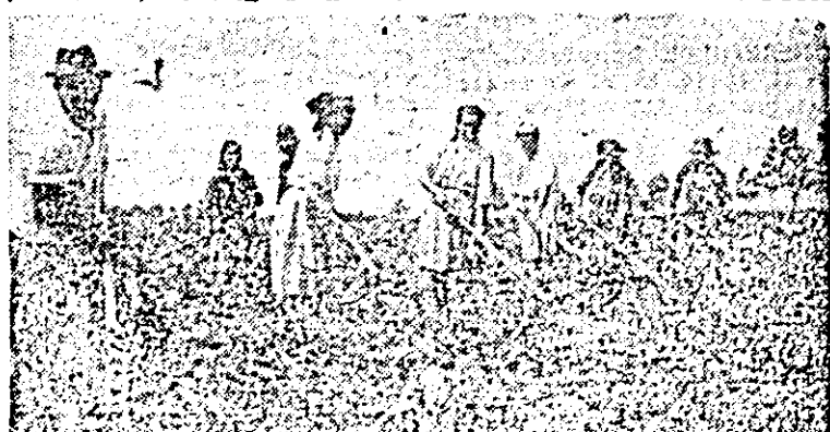
În atenția cooperativelor din Pecica se află și întreținerea tuturor culturilor prășiitoare