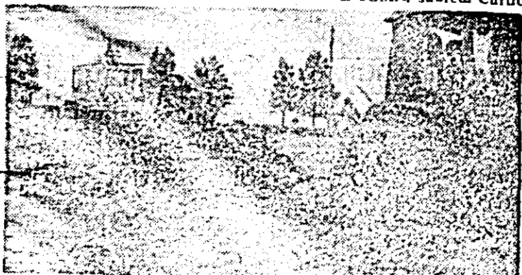
Pe ogoarele Curticelului, paralel cu recoltatul grîului, se urgentează balotatul palelor.