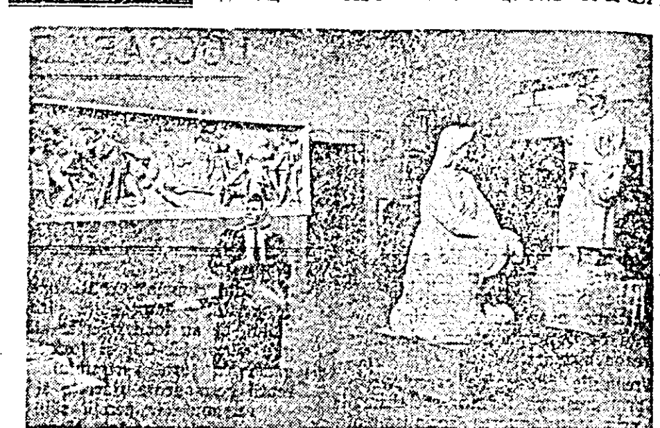
La Timișoara s-a deschis de curînd expoziția regională de artă plastică. Cîlșeul nostru reprezintă un colț al expoziției. În față, sculptura „Mulgătoarea” a sculptorului arădean Ioan Tolan. Pe peretele din dreapta baso-reliefulurile sale.