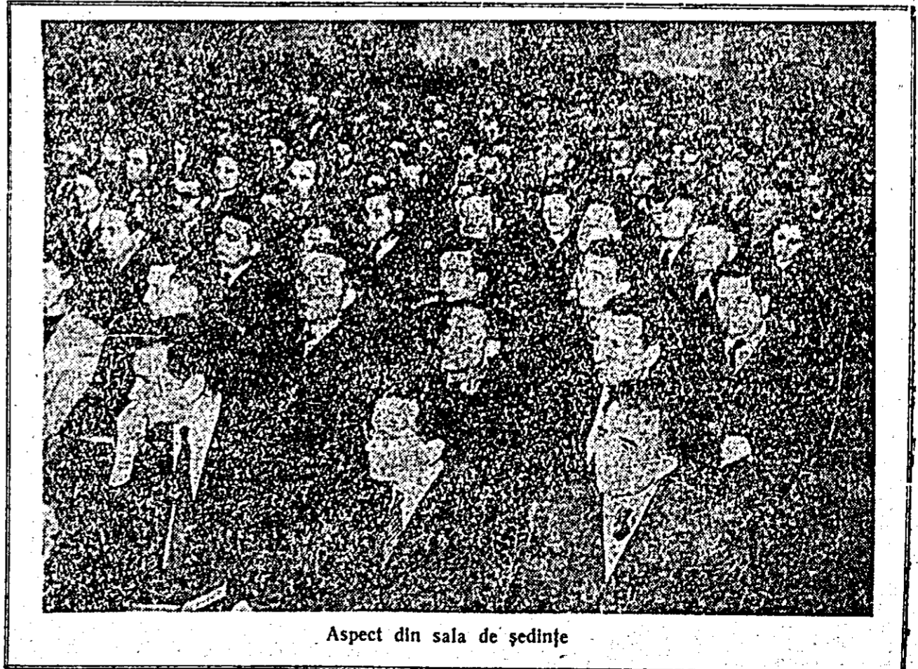
Aspect din sala de ședințe