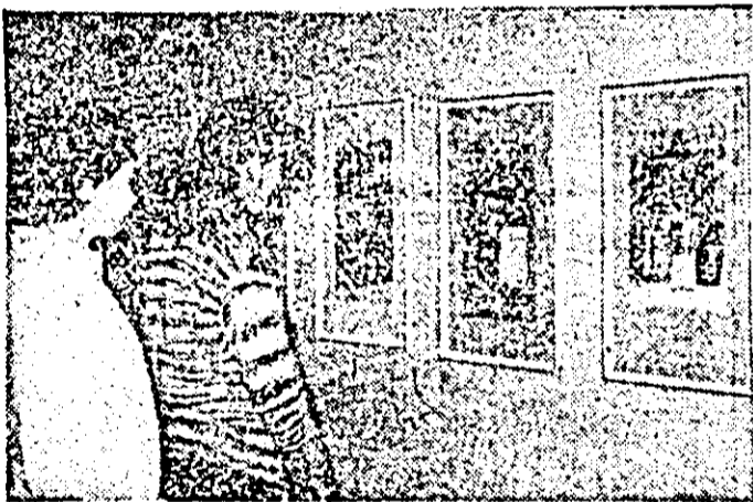
Aspect din expoziție.