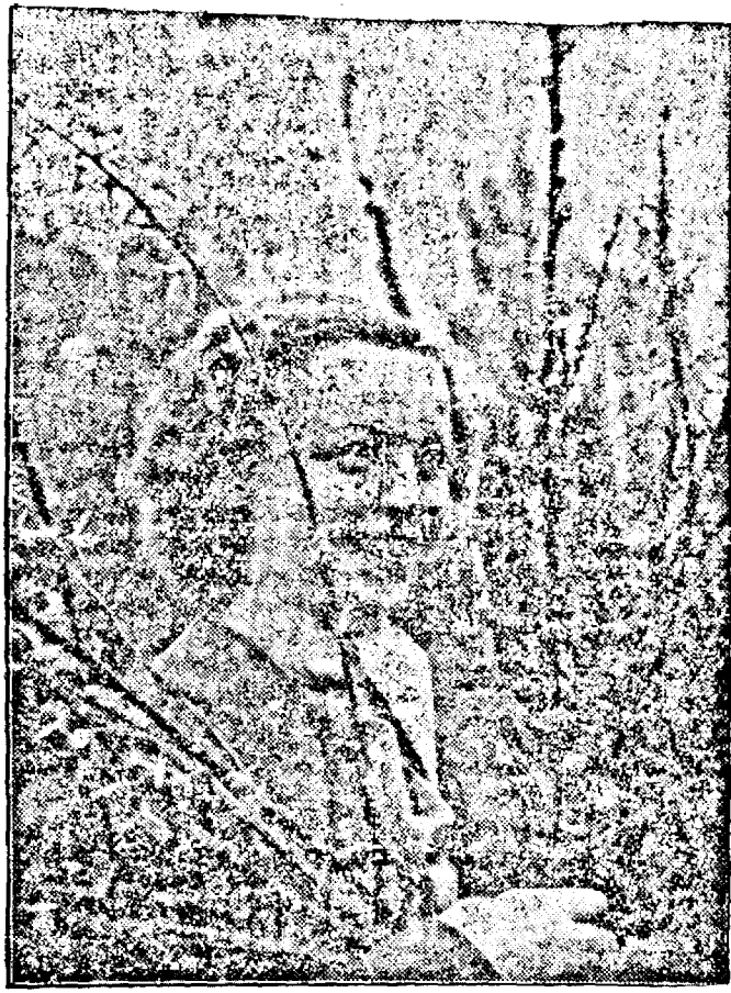
Drăgălașa vedetă HANZI KNOTECK, care va apare în curând în marea capodoperă a casei UFA: „Satul cu păcate”.