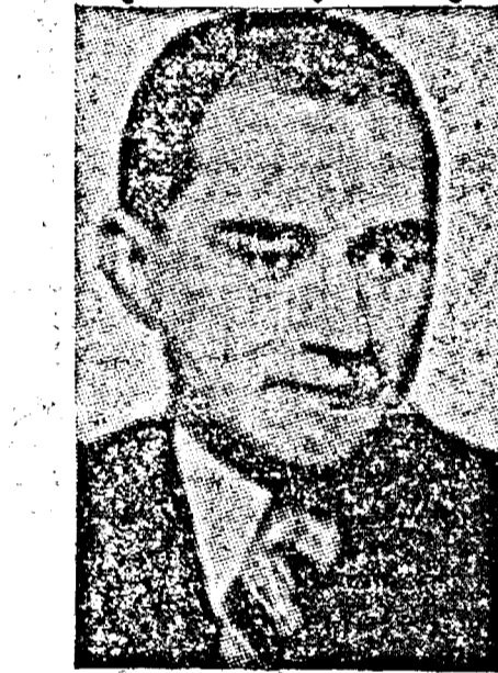
D. MIHAI ANTONESCU

Vicepreședintele Consiliului de Miniștri