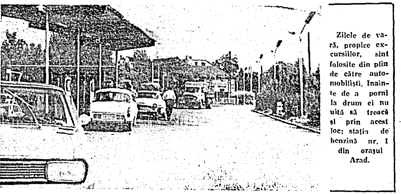
Zilele de vară, propice excursiilor, sint folosite din plin de către auto-mobilisti. Inainte de a porni la drum ei nu uită să treacă și prin acest loc: stația de benzină nr. 1 din orașul Arad.

Entuziasma primire pe care Praga a făcut-o conducătorilor de partid și de stat români a constituit o expresie vie, emoționantă a simțămîntelor profunde de prietenie nutrită de poporul cehoslovac față de România socialistă, față de poporul frate român, față de conducătorii săi, a dorinței împărțite de ambele popoare de a da un continut tot mai bogat relațiilor de prietenie și colaborare multilaterale, dorință ce își găsește intruchiparea în noul Tratat de prietenie, colaborare și asistență mutuală, care va fi semnat în cursul actualului vizite.