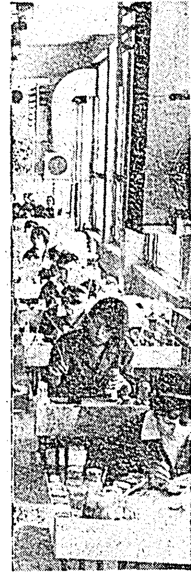
Secvență din secția plastică a întreprinderii „Arădeanca”. Aici papișul și figurinele prind „viața” din minile meșterilor ale lucrătoarelor. IN CLIȘEU: aspect din secția pictură.