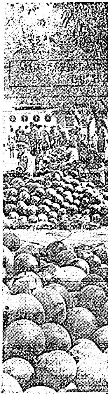
ÎN CLISEU: secvență dintr-o plată ardeană, la ore matinale.

Vineri, 16 august În jurul orei 14,15 — Transmisiune în direct de la Praga. Mitingul organizat cu prilejul vizitei în Republica Socialistă Cehoslovacă a delegației de partid și de stat a Republicii Socialiste România în frunte cu tovarășul Nicolae Ceaușescu. 17.30 Pentru școlari: Ex-Terra '68. 18.00 Drumuri și pepasuri 18.30 Curs de limba spaniolă (reluarea lecției a 5-a). 19.00 TV pentru elevi — 19.30 Telemagazin de seară. 20.00 Actualitatea în agricultură. 20.20 Studioul muzical. 20.40 Varietăți... de la mare. 21.00 Reflector. 21.15 Film artistic: „Hiperbologul inginerului Garin”. 22.50 Telemagazin de noapte.