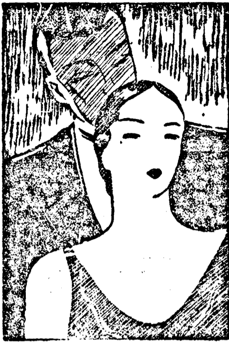
A Jockey Club vonat illatos kölnivízének csomagja.