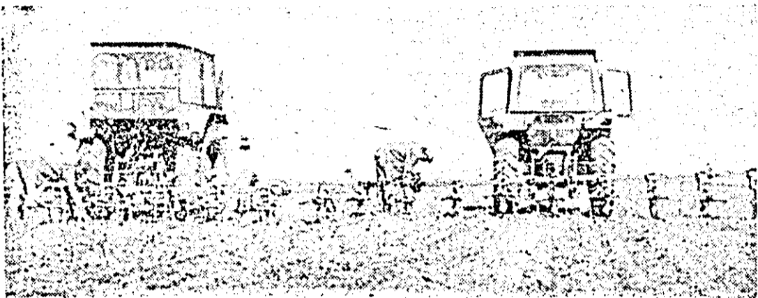
O lucrare actuală care trebuie executată cu maximă atenție — prășitul mecanic al porumbului.