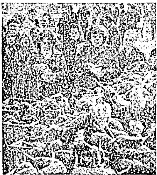
În Piața U.T.A. au sosit, în slăbit, la ora 11,30 vinetele!

rea produselor de la furnizori și de a nu permite rabaturi la calitate. Cum își fac datoria acesti oameni? Ați întreprins vreun control?