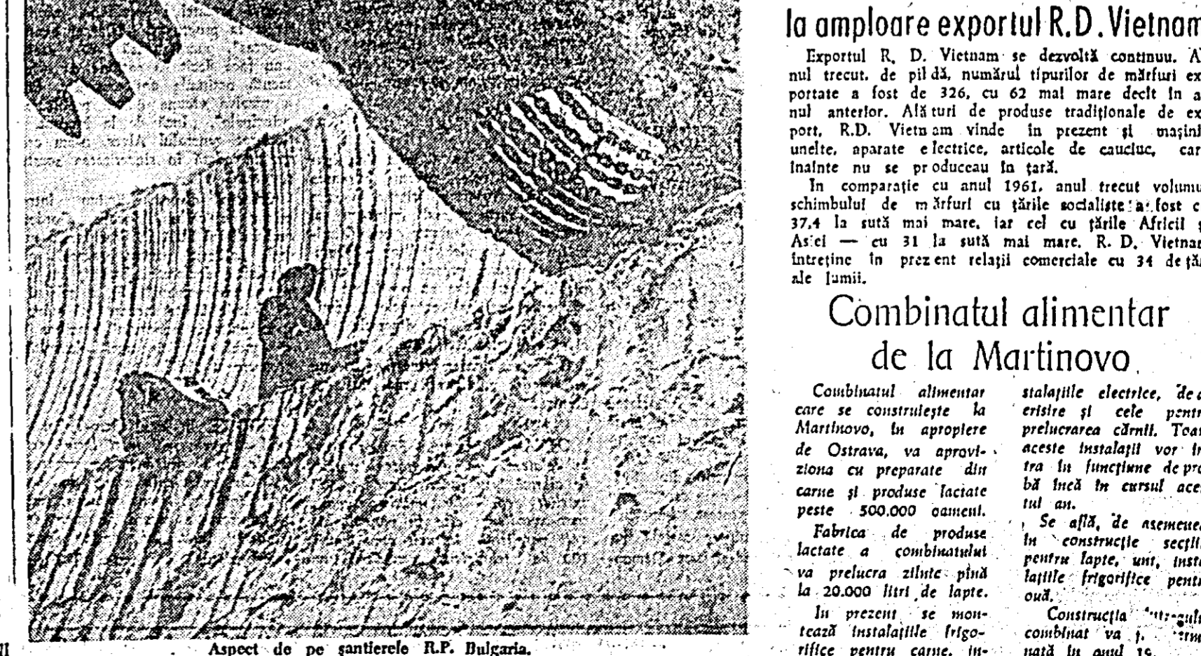
Aspect de pe șantierul R.P. Bulgaria.

Construcția combinatului va fi înmănată în anul 1964.