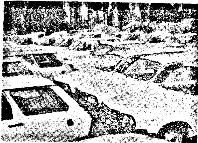
Avem și la Arad „I.D.M.S.”-ul nostru.