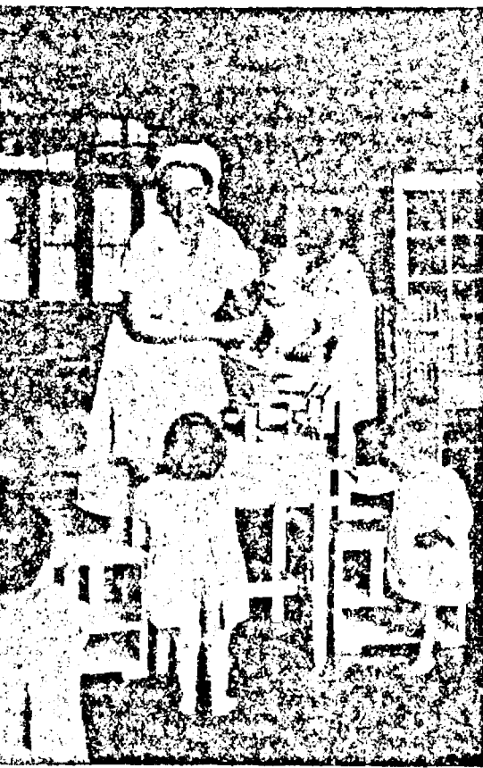
Scenă din viața sugacilor Industria Lânei. Azilul de sugaci. Cântărirea zilnică.