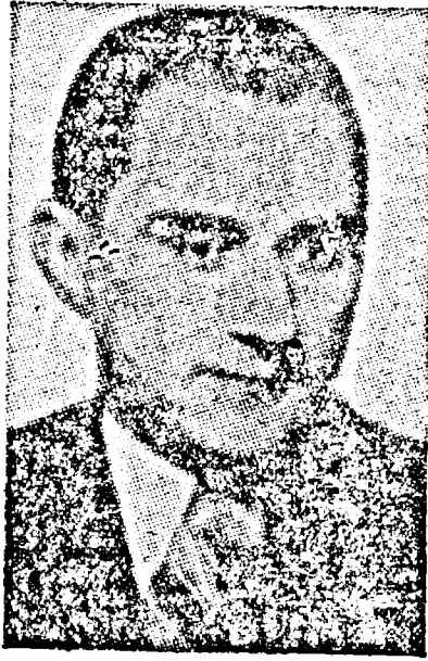
menilor de stat și puterilor unite pentru a combate bolșevismul. Ministrul de externe al Reichului a...