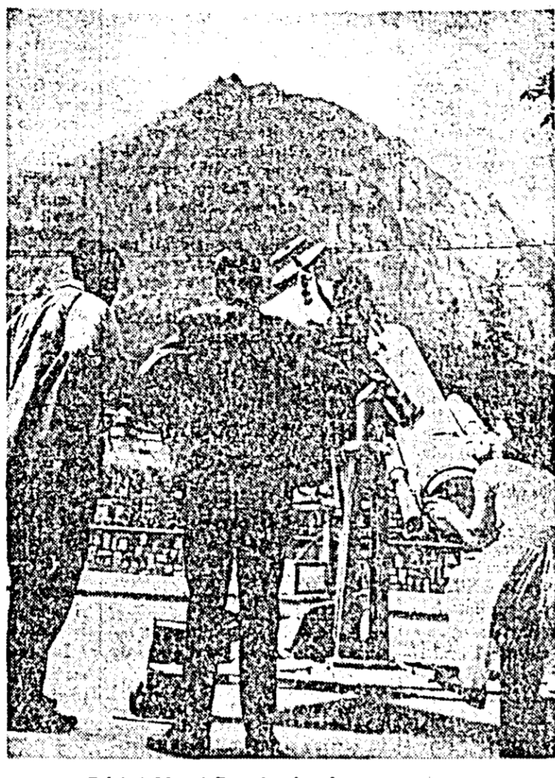
Privind Munții Bucegi prin telescop