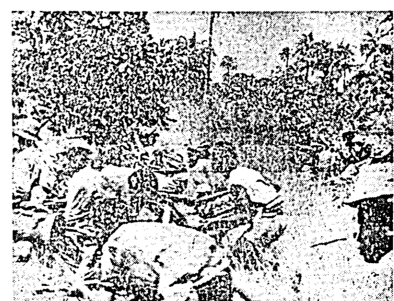
O unitate a forțelor patriotice din Guinea portugheză dezlănțuind un atac împotriva trupelor colonialiste.