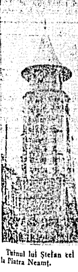
Tîrnul lui Ștefan cel Mare de la Piatra Neamț.