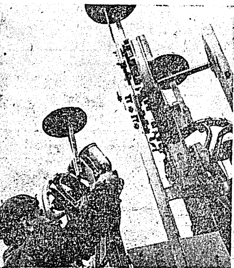
Un nou lot de semnale de barieră construite de către muncitorii Atelierelelor C.T. C.F.R. Arad, gata să fie montate pe drumurile beneficiarilor.