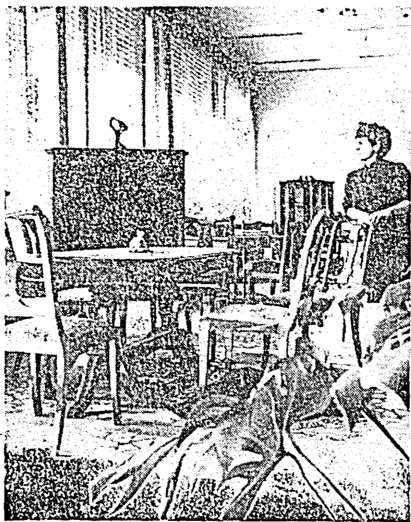
Instanțaneu în expoziția de produse a Fabricii de mobilă Arad.

Radioteleviziunea română organizează într-o formă nouă emisiunea concurs: „La șase pași... o excursie”. Concursul va avea loc în perioada octombrie 1968 - decembrie 1969 în patru etape, participând toate cele 30 de județe, plus echipa reprezentativă a Capitalei. Zi la ora 8.45 pe micul ecran vom putea urmări prima etapă a concursului în care echipa formată din opt pionieri, elevi ai claselor VII și VIII de la Liceul nr. 2 Arad, reprezentativă județului, va concura de-a lungul a șase probe: literatură, istorie-geografie, știință și tehnică, sport-drumeție, muzică-dans, îndemânare cu reprezentanții județului Alba. Le dorim succes! prof. V. JIREGHIE