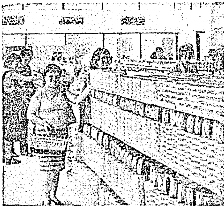
O unitate model. Magazinul alimentar din Piața Mihai Viteazul.