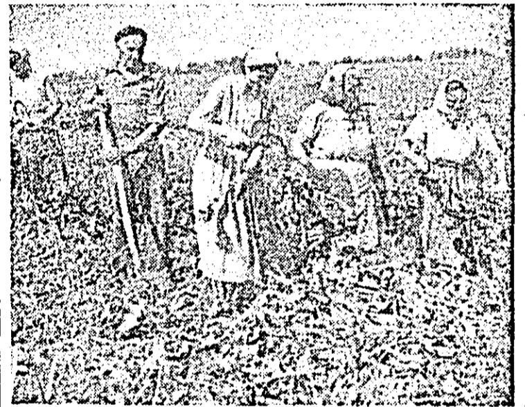
La C.A.P. Mălat a început recoltatul sfeclii de zahăr.