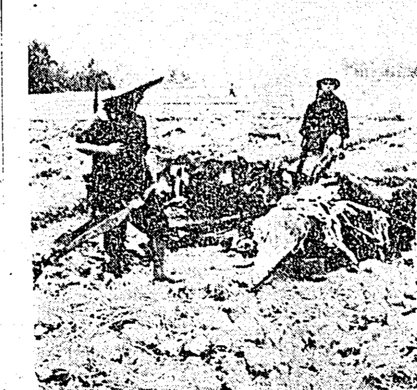
Încă un agresor răpus, un avion fără pilot al aviației americane, doborît deasupra Hanolului, a sîrșit într-un lan de ore. de unde este evacuat și dat la topit.

TEL AVIV 27 (Agerpres). — Surse oficiale din Tel Aviv au anunțat în zorii zilei de sâmbătă dispariția submarinului izraelian „Dakar”, avînd un deplasament de 1280 tone și un echipaj de 65 de oameni. El se afla în apele Mării Mediterane, la aproximativ 160 kilometri de Insula Cipru. Nu se cunosc pînă în prezent nici un fel de amănunte în legătură cu dispariția submarinului. „Dakar” este unul din cele patru submarine ale Izraelului. Vase și unități de aviație izraeliene întreprind cercetări asidue pentru găsirea lui. Participă, de asemenea, avioane și nave britanice. După cum anunță agenția France Presse, distrugătorul englez „Diana”, dotat cu un echipament specializat, va părăsi portul Malta în direcția locului în care se crede că a dispărut submarinul izraelian „Dakar”.