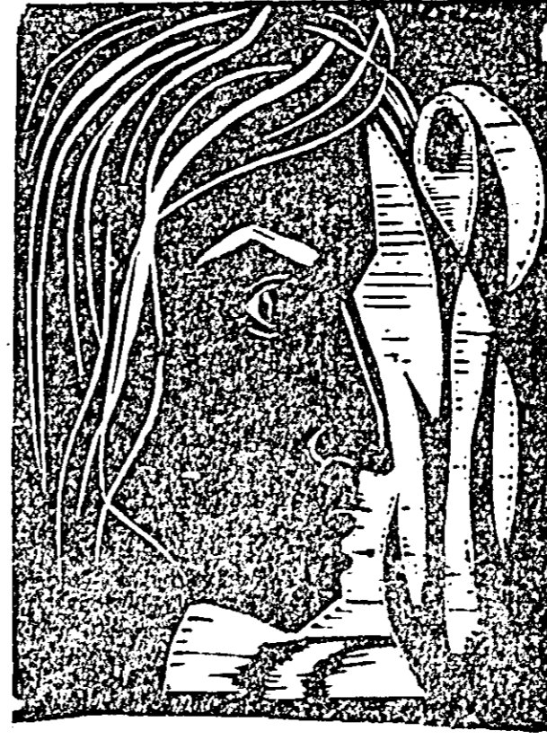
„VISLAȘUL” — linogravură V. SANDU

celor acțiuni inițiate în perioada „Lunii cărții la sate”. Pentru stimularea răspândirii cărții, Uniunea Centrală a Cooperativelor de Consum va lansa în luna februarie un concurs cu premii, menit să desemneze pe cei mai activi difuzori de carte în mediul rural. Prilej pentru numeroase activități adresate minții și inimii, menite să sporască interesul pentru lumina și frumusețea cărții, „Luna cărții la sate” este un profund act de cultură, cu aspecte multiple, care presupune din partea tuturor organizațiilor de masă și obștești solitudine și o sporită contribuție pentru reușita acestei manifestări.