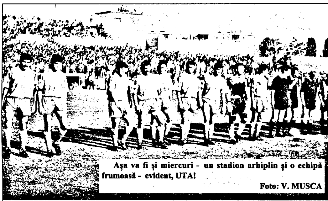
Așa va fi și miercuri - un stadion arhiplin și o echipă frumoasă - evident, UTA!