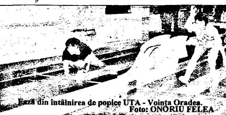
Fază din întâlnirea de popice UTA - Voința Oradea.