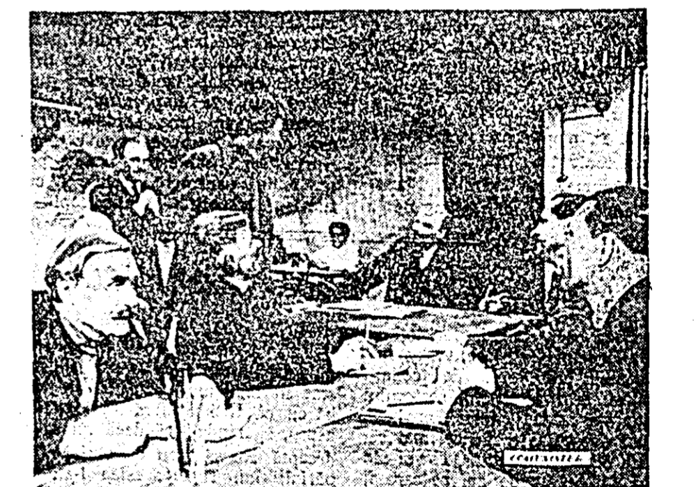
Azi, la orele 10.30, în sala cinematografului „Gh. Doja” are loc un simpozion cu filmul „Comunistul”, o producție în culori a studioului „Mostfilm”.

Min a-nțeles că iubitul ei de multă vreme s-a risipit sub pietre. Ea blestemat pe crutul Shu han-Ting. Acesta l-a auzit cuvîntul și a răcnit: „Femeie, eu sînt stăpîn pe vremii