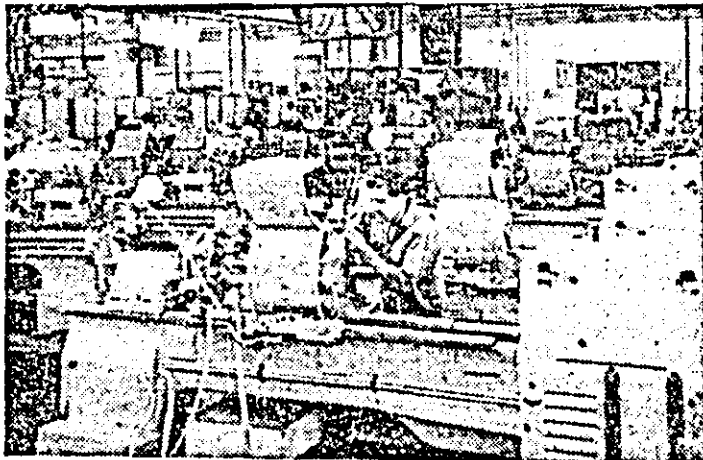
Secvență de muncă de la întreprinderea de strunguri din Arad.

• Să se ia măsuri ferme pentru lichidarea neajunsurilor din zootehnie, asigurându-se buna îngrijire a animalelor, realizarea producției de carne și lapte!