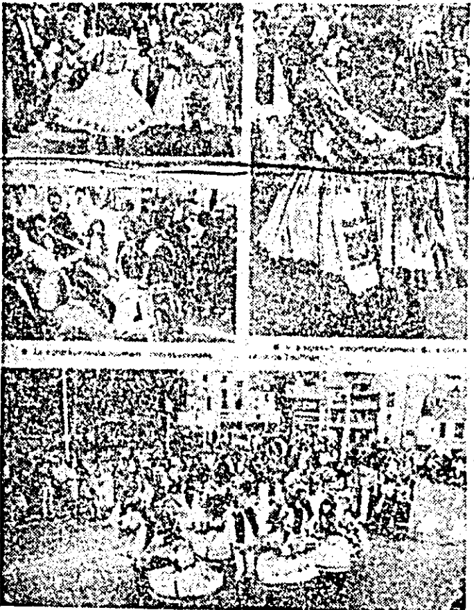
Instantanee din presa franceză privind evoluția artiștilor amatori inenani.

ansamblul „Doina Crișului” a prezentat peste 60 de spectacole atât în localitățile județului nostru, cât și în județele Bihor, Hunedoara și Timiș, ajungînd apoi în țara republicană a Festivalului Național „Cîntarea României”, lauză deslăsurată duminică trecută la Deva, unde, de a-