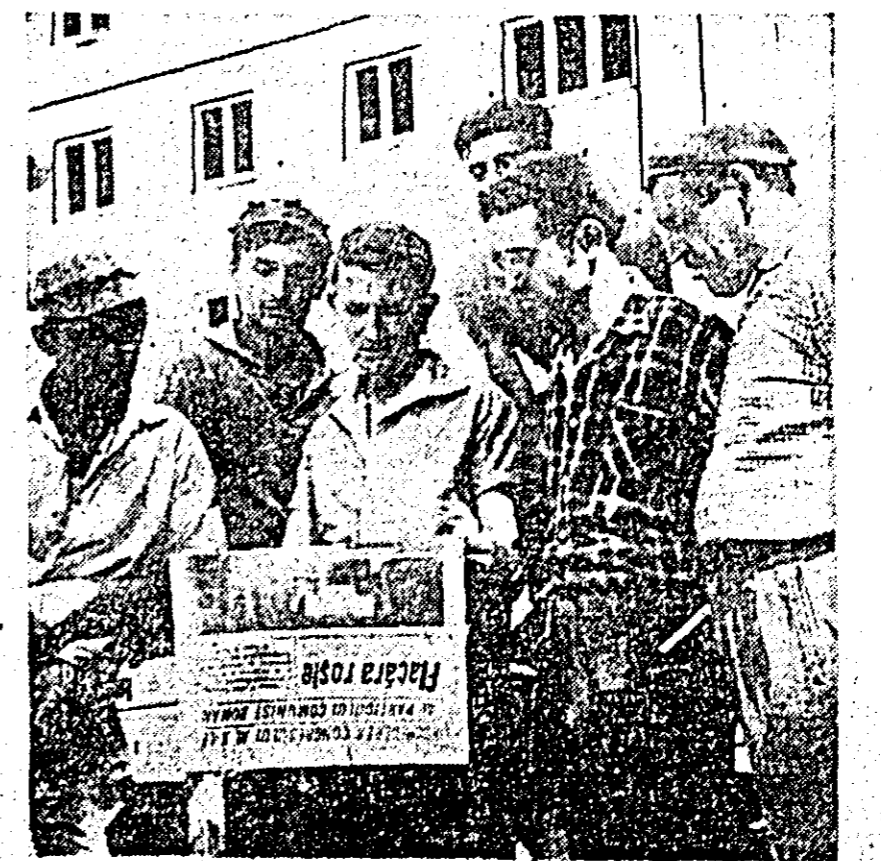
În pauzele de lucru constructorii arădani urmăresc cu viu interes, din ziare, desfășurarea lucrărilor Congresului.