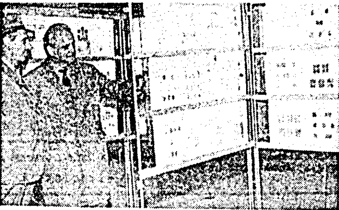
Aspect din cadrul expoziției de filatelic organizată în cadrul festivalului „Primăvara arădeană” la Casa municipală de cultură.