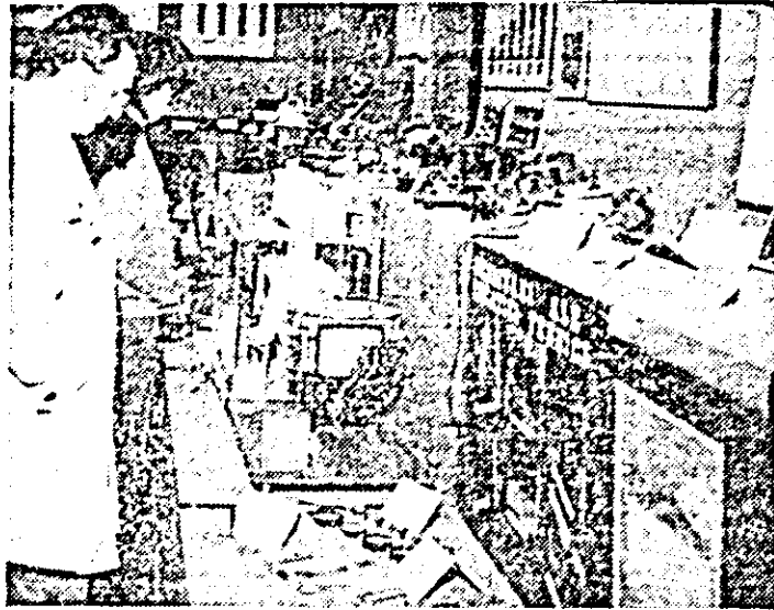
Instantaneu de la deschiderea „Salonului arădean de creație tehnico-științifică”, organizat de Consiliul județean al sindicatelor în sala „Forum” din Arad.