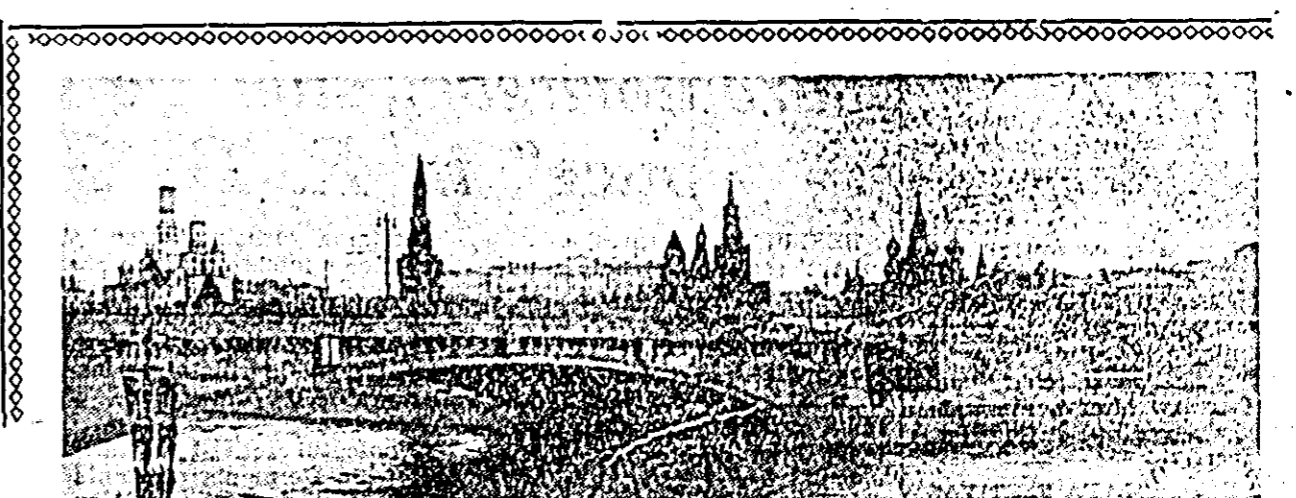
MOSCOVA, minunata capitală a U.R.S.S.