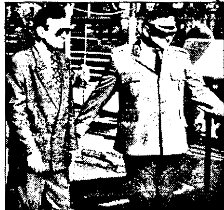
Faceți loc! S-a întors Miron Cozma