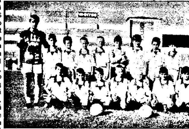
F.C. UTA '88 - campioană județeană