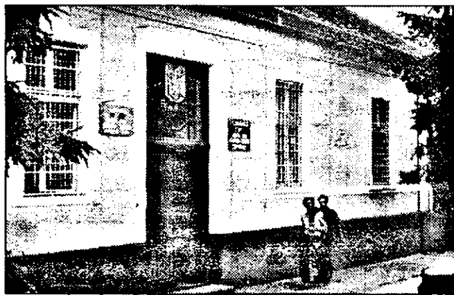
Cu toate că sunt sub același acoperiș, între Primăria și Poliția Șimand nu există nici un fel de colaborare. Din contră...