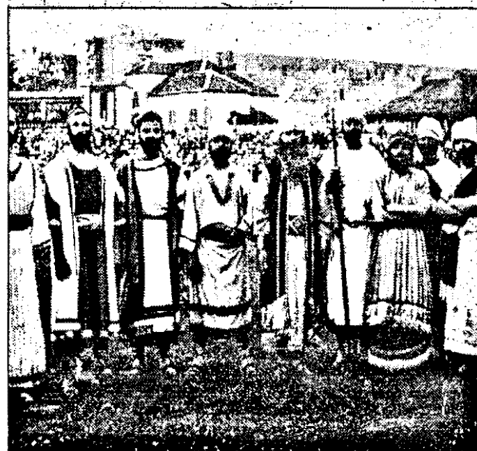
„Familii, faceți din citirea zilnică a Bibliei un mod de viață”, spun Martorii lui Iehova

Duminică, 12 iulie 1998, orele 17,00, la Căminul Cultural din Șiria va avea loc Reuniunea corală, la care participă formațiile corale din: * Bârsa; * Buteni; * Covăsânt; * Șiria; * „Pro Musica” - Ungaria; * „Monkranjac” - Serbia.