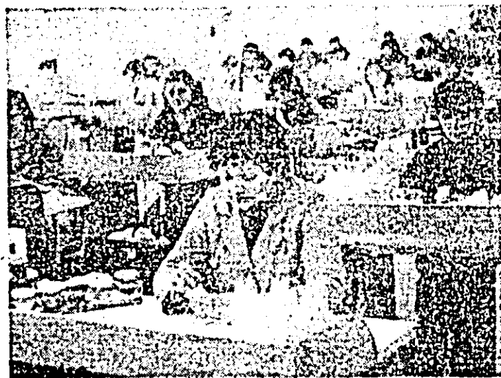
Aspect de muncă în secția pietat a Întreprinderii „Arădeanca”.

A fost de față Boncio Mitrev, ambasadorul Bulgariei la București