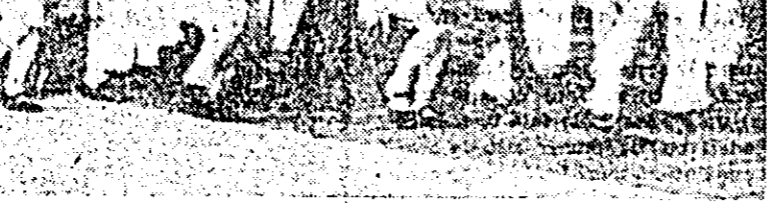
Formația de dansuri populare a pionierilor din Căpîlnas, laureată a festivalului cultural-artistice al pionierilor și școlărilor.