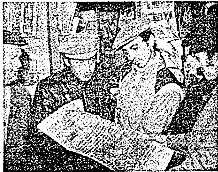
Interes deosebit, aprobare deplină față de Raportul prezentat de tovarășul Nicolae Ceaușescu la Congresul al XIII-lea al partidului.

Alese gânduri și sentimente de prețuire și profundă recunoștință față de conducătorul încercat al partidului și statului nostru, tovarășul Nicolae Ceaușescu, hotărârea fermă de a acționa cu înalt simț de răspundere pentru îndeplinirea exemplară a tuturor sarcinilor ce le vor reveni din documentele adoptate de Congresul al XIII-lea se regăsesc și în telegramele adresate de comitetele orașenești și comunale de partid Sebiș, Hălmagiu, Socodol, Seitin, Secușigiu, Gurahont, Săvârșin, Birzava, Sicula, Livada, de către membrii cooperatori de la C.A.P. Chișneș Criș, „Victoria” Nădlac, Moroda, Vârșand, Felnac, Șiria, Sălcăuț, C.A.P. „Lumea nouă” Curtici.