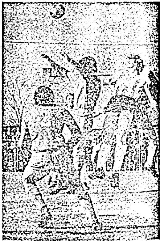
Fază din meciul Strungul—Victoria Ineu.