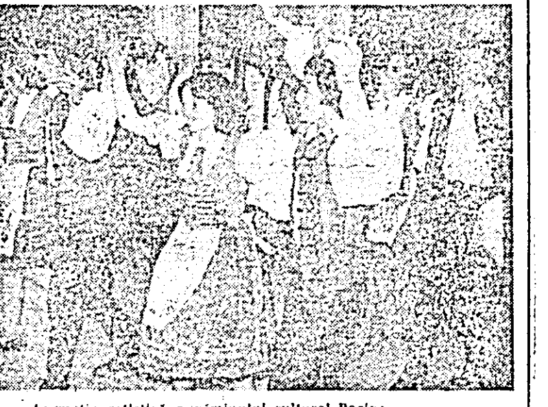
Formația artistică a cîminului cultural Pecica

Întreaga seară cultural-districativă s-a înscris ca o reușită manifestare închinată primăverii, constituind, totodată o expresie a trăirii ce leagă locuitorii județului nostru, indiferent de naționalitate, reliefînd în mod elocvent că frumusețea obiceiurilor folclorice ale populației de naționalitate maghiară se transmite nestingherit de la o generație la alta.