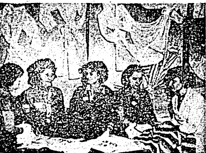
La „Tricoul roșu” se pregătesc noile modele pentru anul 1982.