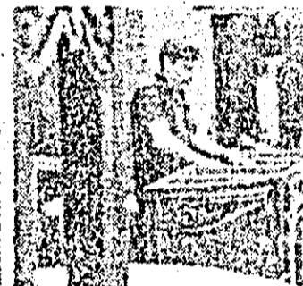
C.P.L. Aspect de muncă în secția a IV-a profolopului.

Activitatea de creație tehnică cunoaște noi dimensiuni și la întreprinderea „Liberitatea” din municipiul nostru. Recent, aici s-a asimilat o nouă tehnologie de coasere a fetelor de încălziminte dinolocutorii de piele direct pe talpă.