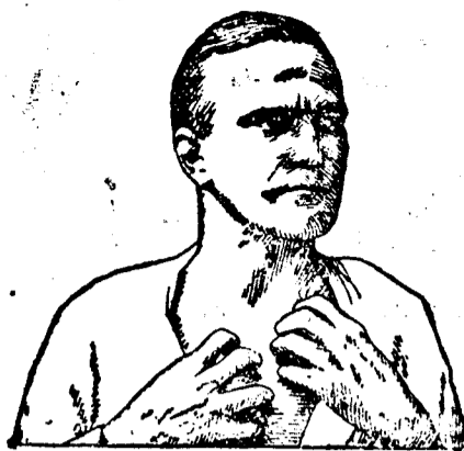
Ha bőrbetegségben szenved, használja a CADU W-KENOCST

A nagy szenzációt keltett mohamedán házasság tehát súlyos fordulóhoz érkezett el s mivel az ügy előreláthatólag precedens lesz, országsszerte nagy érdeklődéssel tekintenek a