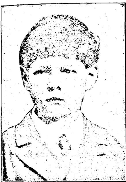
M. S. Regele Mihai I.