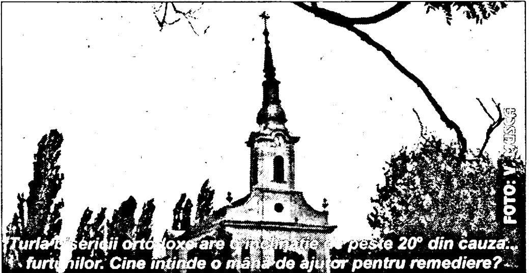
Turla bisericii ortodoxe are o înclinare de peste 20° din cauza... furtunilor. Cine întinde o mână de ajutor pentru remediere?