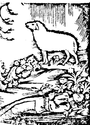
Miorița de Demian