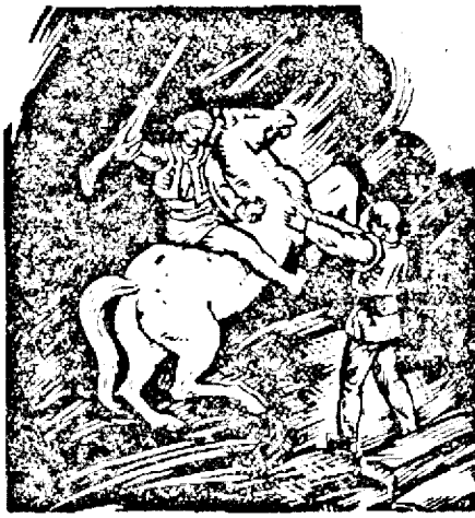
Gruia de Demian

„Veni-va ziua sfântă când vântul mântuirii Va duce corbi și nouri pe calea pribegirii,