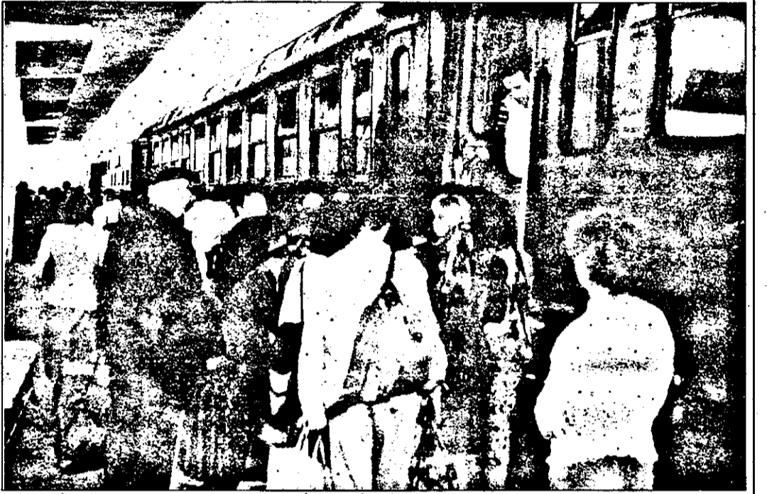
Deși tarifele la transportul pe calea ferată cresc continuu, condițiile de călătorie (căci de confort nu putem vorbi), devin tot mai proaste. Mai ales că odată cu primele ninsoiri, trenurile au fost luate cu asalt.